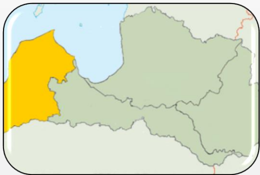
«Mans labākais ginekologs» Kurzemē