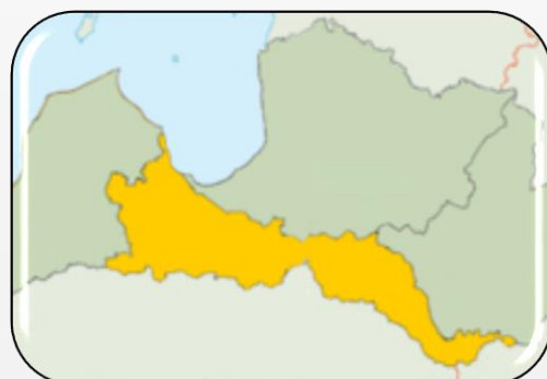
«Mans labākais ginekologs» Zemgalē