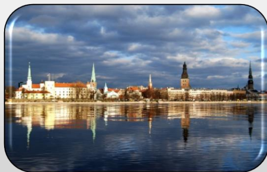
«Mans labākais ginekologs» Rīgā un Rīgas reģionā