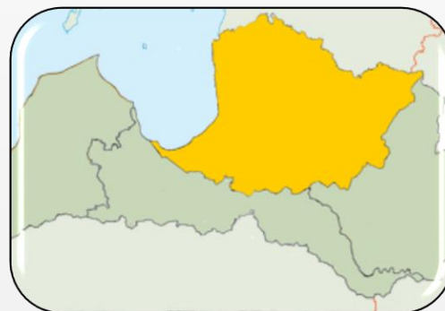
«Mans labākais ginekologs» Vidzemē