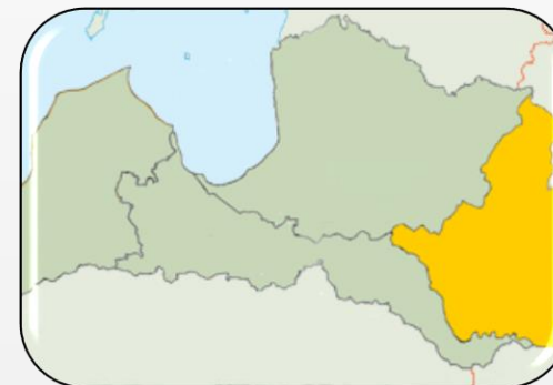
«Mans labākais ginekologs» Latgalē