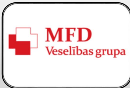
MFD Veselības grupas iemīlotākais ginekologs